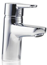
Die Armatur-Empfehlung EWT

Die optimierten Wege sorgen für 80% weniger stehendes Wasser im Armaturenkörper im Vergleich zu herkömmlichen Einhebelmischern.